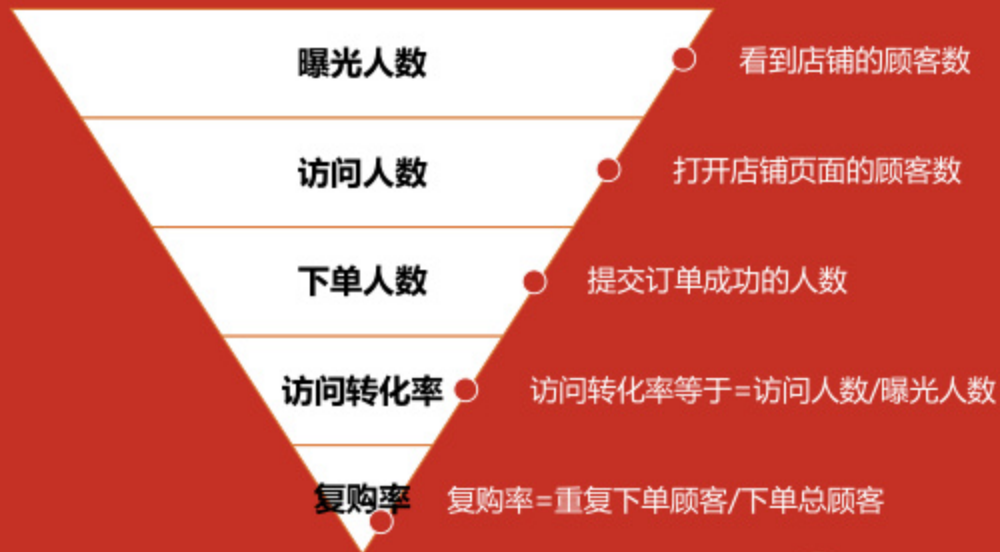
运营理论:漏斗模型